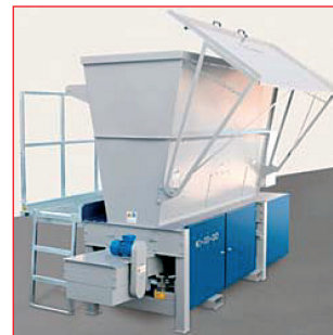
Faserdosiermaschine FS 1700/400