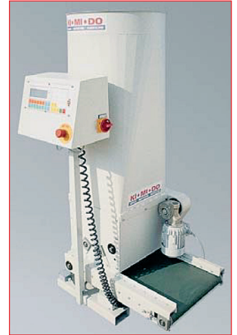
Faserdosiergerät F-4R/400 mit Wägeterminal